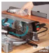
Штитник на сечило

Можност за прецизно прилагодување на висината на масата Механизмот со запчет лост овозможува лесно и прецизно прилагодување на висината на масата, како и контролирано и стабилно сечење при работа со различни материјали и примени.