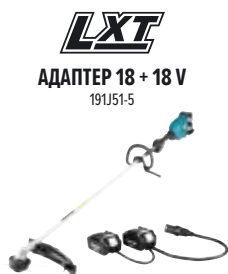
LXT АДАПТЕР 18 + 18 V 191J51-5