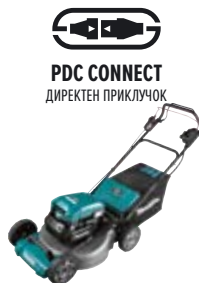
PDC CONNECT ДИРЕКТЕН ПРИКЛУЧОК