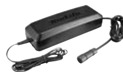
Полнач DC4001 191L00-4*