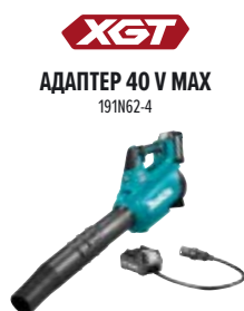
XGT АДАПТЕР 40 V MAX 191N62-4